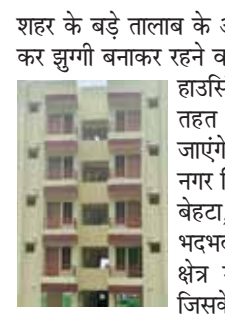
हरिभूमि न्यूज़ ►► गोपाल

शहर के बड़े तालाब के आसपास कब्जा कर झुग्गी बनाकर रहने वाले परिवारों को हाउसिंग फॉर ऑल के तहत मकान दिए जाएंगे। इसके लिए नगर निगम खानूगांव, बेहटा, बोरबन, भदभदा के आसपास क्षेत्र में सर्वे करेगा। जिसके आधार पर इन परिवारों को बारिश बाद शिप्ट किया जाएगा। बड़े तालाब के फुल टैक लेबल के आसपास करीब तीन सौ परिवारों ने झुगियां बनाकर कब्जा कर लिया है। तालाब में पानी बढ़ने के बाद इन परिवारों को खतरा बढ़ जाता है। जिसको लेकर अब इन परिवारों को तालाब किनारे से हटाया जाएगा। इधर, तालाब किनारे लगातार हो रहे कब्जों को लेकर निगरानी भी बढ़ाने की तैयारी निगम ने की है।