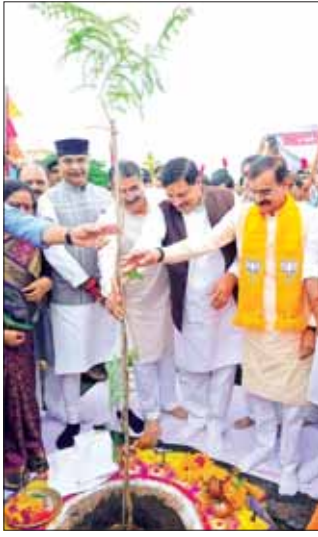
मोपाल

मम में साढ़े पांच करोड़ पौधरोपण का महाअभियान शनिवार से मोपाल से शुरू हो गया। इसकी शुरुआत मोपाल के जंबूरी मैदान में मुख्यमंत्री डॉ. मोहन यादव ने अपनी मां के नाम पौधरोपण से की।