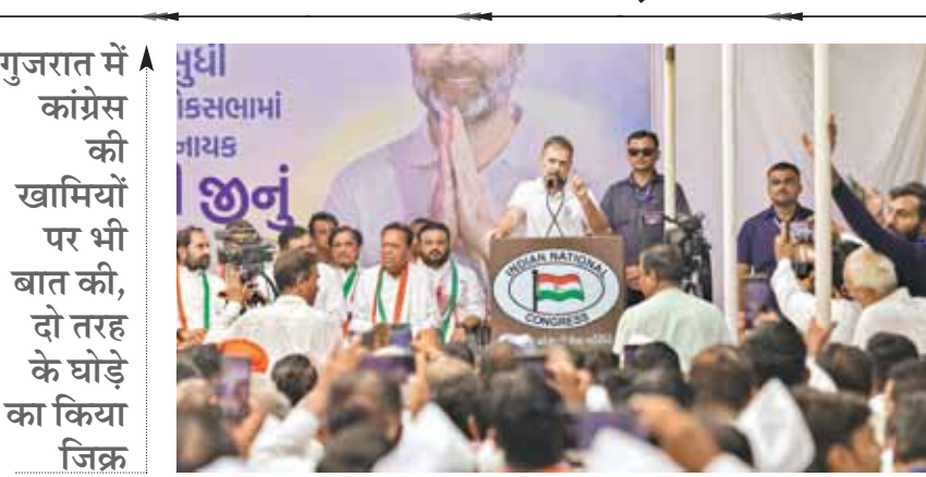
गुजरात में कांग्रेस की खामियों पर भी बात की, दो तरह के घोड़े का किया जिक्र