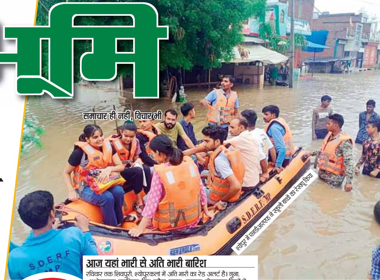
समाचार ही नहीं, विचारनी

मध्यप्रदेश, छत्तीसगढ़, हरियाणा व दिल्ली से एक साथ प्रकाशित