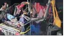
अनुपपुर से शहडोल की ओर आ रहा था, वहीं ऑटो शहडोल से अनुपपुर की ओर जा रही था, इसी दौरान दोनों गाड़ियों की आमने-सामने टक्कर हो गई।

जिले में शुक्रवार रात दर्दनाक सड़क हादसा हो गया। यहां ऑटो और ट्रैलर की जबरदस्त भिड़ंत हो गई। ऑटो में कुल छह लोग सावर थे, जिसमें दो महिलाओं की मौके पर ही मौत हो गई एवं दो महिलाओं की मेडिकल कॉलेज में मौत हुई है। 2 लोगों की हालत गंभीर बताई जा रही है। ट्रैलर